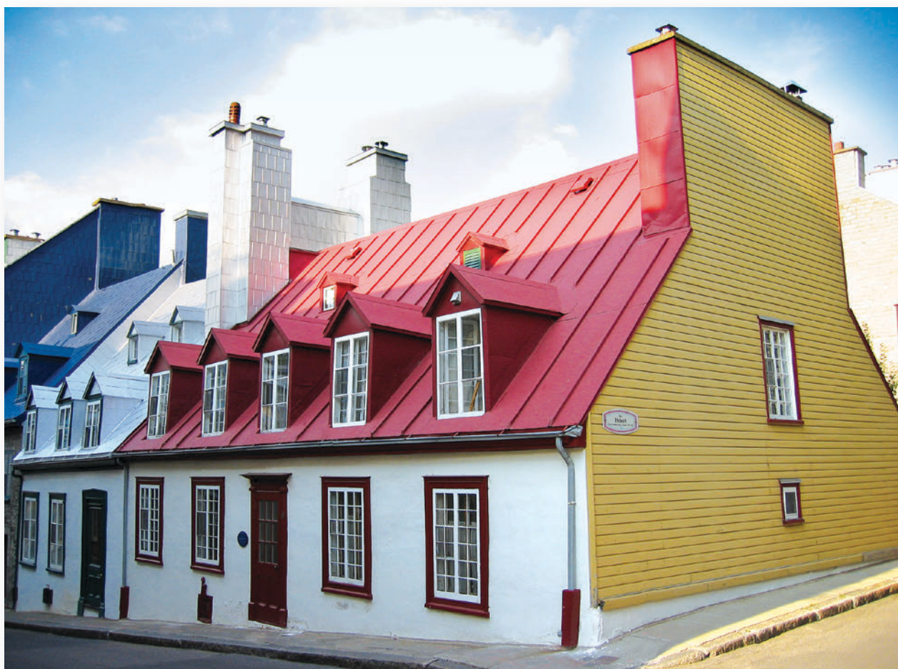
▲ L'habitat domestique urbain diffère peu de celui rural, les différences résidant d'abord dans les attributs associés à la lutte contre la propagation des incendies, principalement l'utilisation de matériaux ininflammables (maçonnerie) et les murs coupe-feu. La maison Simon-Touchet, située sur la rue Saint-Famille dans le Vieux-Québec, est probablement construite en partie dès 1747, puis doublée entre 1754 et 1768. Elle n'a subi que peu de modifications depuis le début du XIX e siècle.

© Samantha Rompillon/CIEQ, 2003, Q03-296