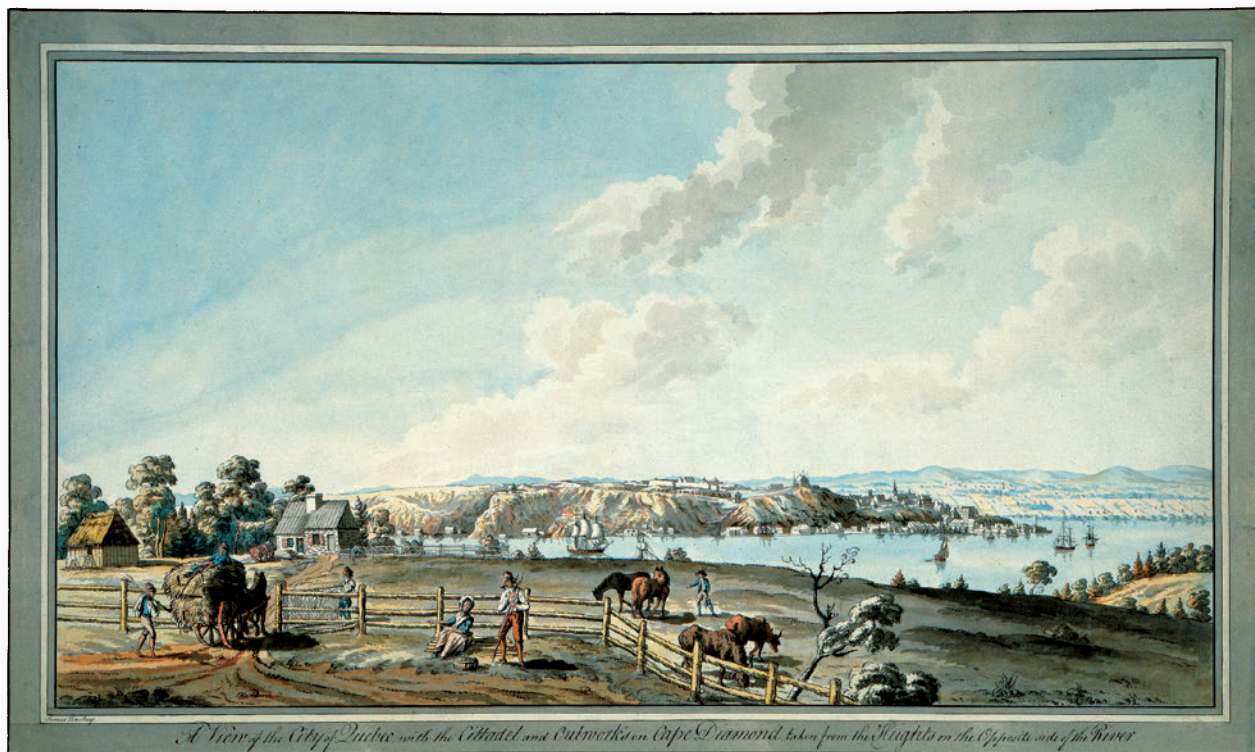
▲ James Peachy, « Vue de la Citadelle et des fortifications du cap Diamant à Québec », vers 1785

L'œuvre de Peachy offre une représentation du mode d'habitat en milieu rural. À côté d'un bâtiment de ferme lambrissé de planches, se trouve la petite résidence familiale en maçonnerie, ici en voie d'agrandissement.