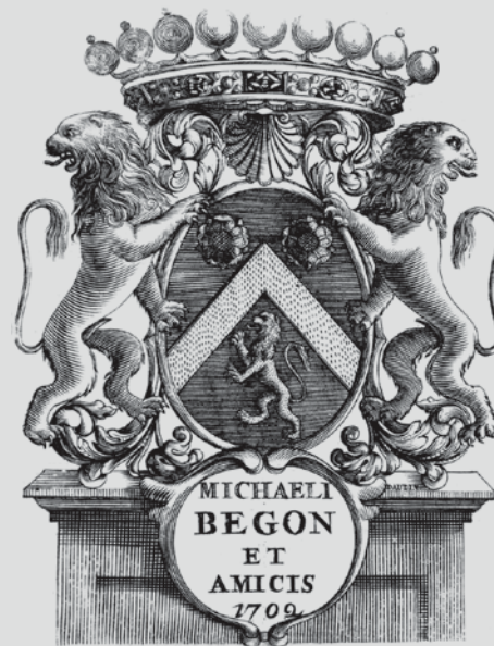
▲ Ex-libris de Michel Bégon, intendant de la Marine à Rochefort à partir de 1688

L'espace Patrimoine et Nouveau Monde conserve également un fonds cartographique d'une grande richesse qui, comme les collections imprimées,