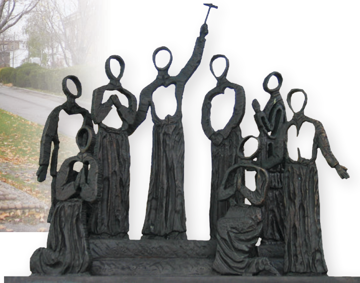
▲ Le monument aux Martyrs canadiens, dévoilé dans le parc des Martyrs à Beauport (Québec) en 1992, honore le souvenir de huit missionnaires jésuites tués par les Iroquois entre 1642 et 1649. Il est composé d'une structure en pierres abritant un bronze représentant les martyrs, œuvre de la sculptrice Thérèse Blanchet-Dolbec.