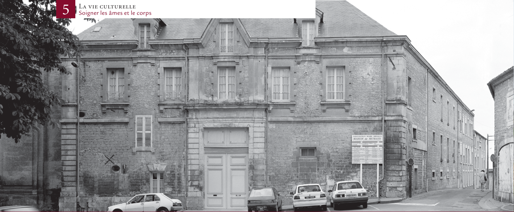
▲ Couvent de l'Union chrétienne à Fontenay-le-Comte