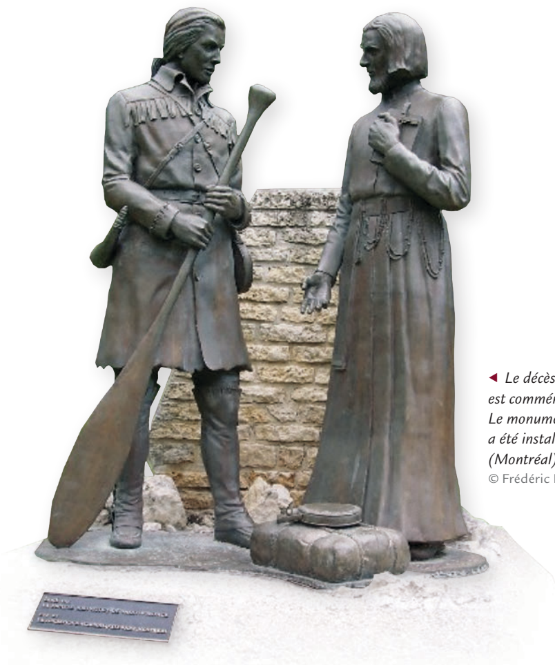
◀ Le décès du père Aulneau et de Jean-Baptiste La Vérendrye est commémoré à Saint-Boniface (Winnipeg, Manitoba). Le monument, réalisé par l'artiste Helen Granger Young, a été installé en 1984 par la Fondation MacDonald Stewart (Montréal).

2005, M01-21