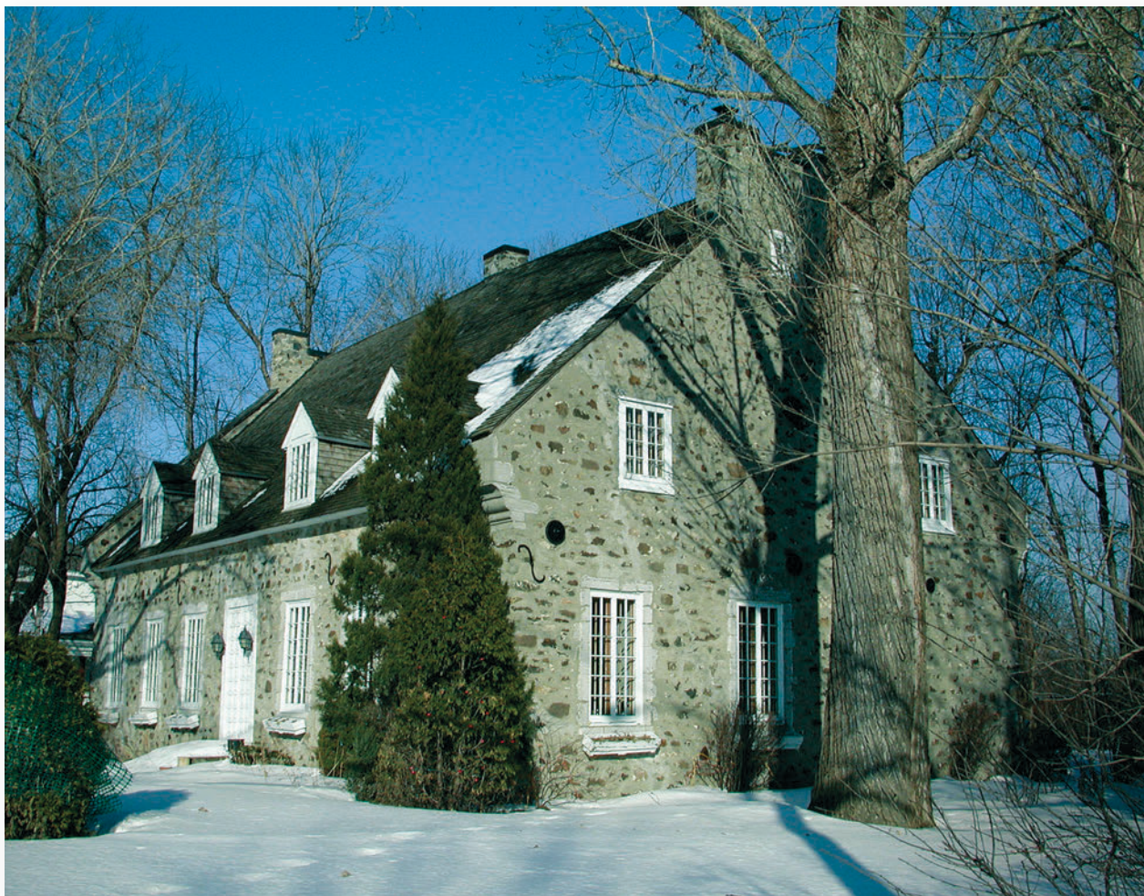
▲ Le manoir François-Pierre Boucher est construit par l'entrepreneur Michel Huet Dulude à Longueuil (Montérégie) en 1741. Classé monument historique en 1974, l'édifice est restauré sous son allure de maison d'inspiration française du XVIII e siècle.