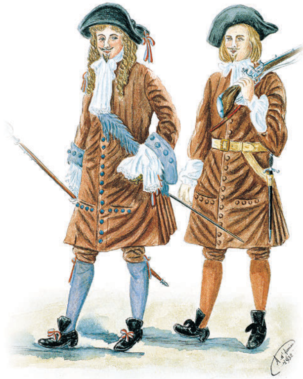
◀ Soldats du régiment de Carignan-Salières ou des compagnies Franches de la Marine, dessin de 1932.

qu'aux Iroquois pendant cette longue marche hivernale, probablement faite sans raquettes. Quand le chevalier de Tracy a mené ses troupes près de la ville actuelle de Schenectady, New York, à l'automne de la même année, leurs seuls exploits furent de brûler des villages mohawks abandonnés bien avant leur arrivée. Toutefois, le résultat obtenu fut celui souhaité : les « sauvages » demandèrent la paix. Sa mission accomplie, le régiment est démobilisé en 1668 et un tiers des soldats, avec quelques officiers, s'établissent au pays.