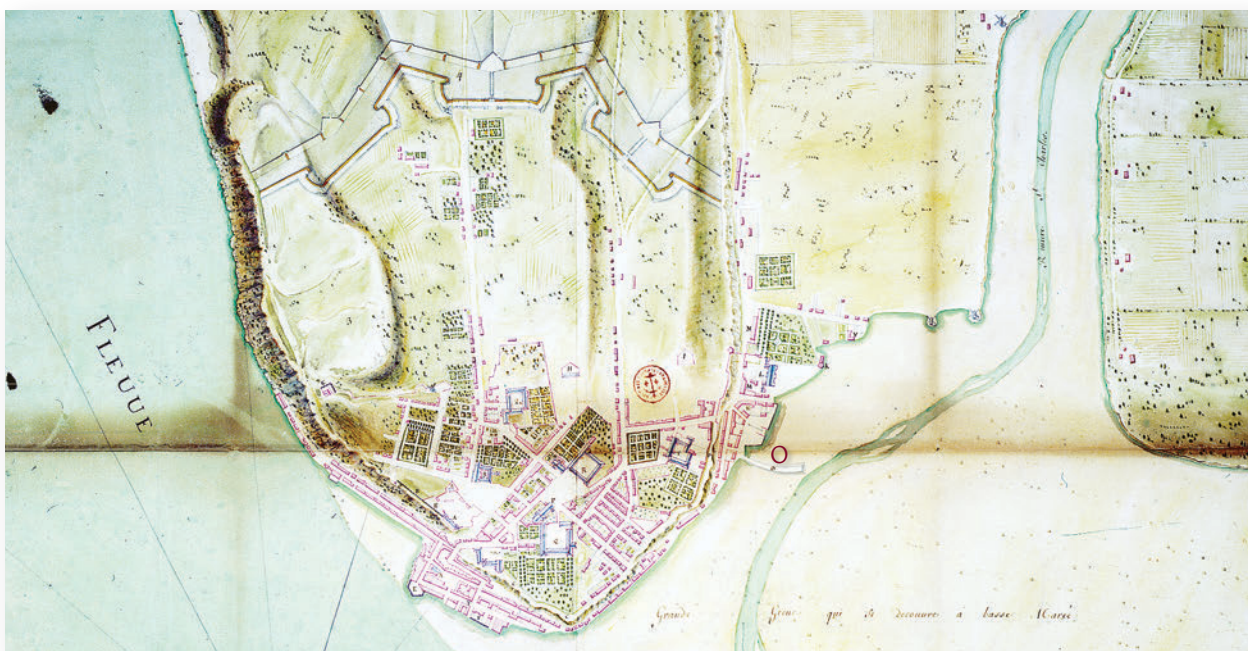
▲ Chaussegros de Léry, « Plan de la ville de Québec, capitale de la Nouvelle-France », 1740 [détail]

Le premier chantier naval royal s'installe sur les rives de la rivière Saint-Charles à Québec. Sur le plan, la jetée servant à protéger les navires est indiquée en Ow; tout à côté, la rampe de lancement des navires, découverte lors de fouilles archéologiques récentes.