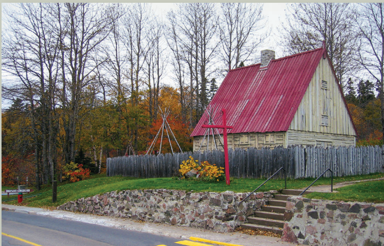
▲ Faisant face à la baie de Tadoussac, la reconstitution du poste de traite rappelle l'établissement de 1600 qui demeure la propriété de Chauvin jusqu'à son décès en 1603.

© Samantha Rompillon / CIEQ, 2005, Q03-1155