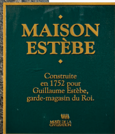
▲ Monument historique classé depuis 1960, la maison de Guillaume Estèbe, garde-magasin du roi aussi engagé dans la pêche au loup-marin sur la côte du Labrador, est construite en 1752 à la Place Royale (Québec). Proche de Bigot, Estèbe sera impliqué dans « l'affaire du Canada » et incarcéré à la Bastille en 1761. Utilisée par la suite pour diverses activités commerciales, la maison est finalement intégrée en 1984 au complexe du Musée de la civilisation.

© Émilie Lapierre Pintal / CIEQ, 2007, Q03-25