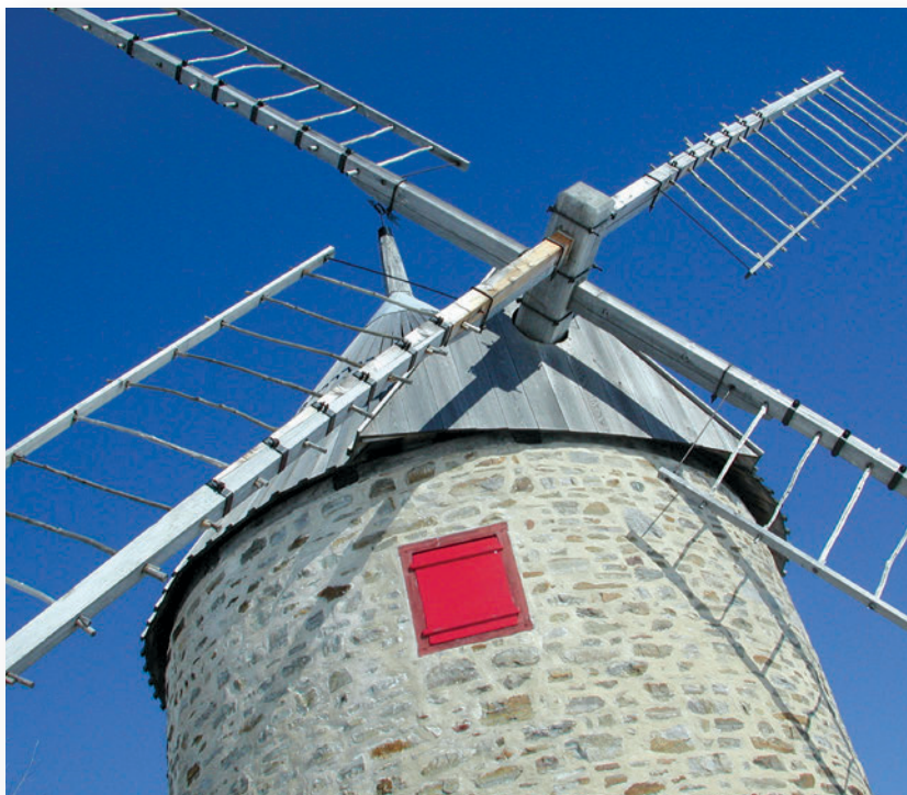
◀ Construit en 1705, le moulin de la Pointe-du-Moulin (île Perrot) demeure en usage jusqu'au XIX e siècle. Monument historique reconnu depuis 1977, il est intégré au parc du même nom.