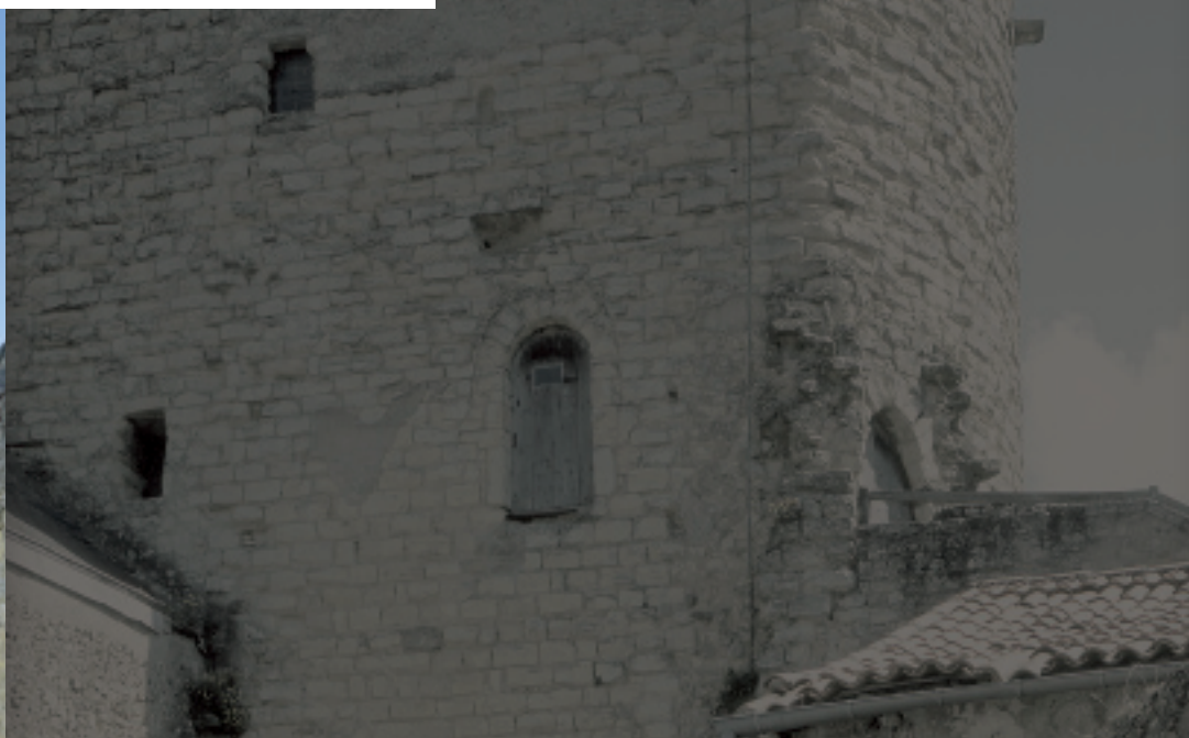
▲ Thouars, la Tour Prince de Galles depuis la rue Félix Gellusseau

Porte de ville érigée à l'extrême fin du XI e siècle sur la ligne de fortifications enserrant la cité médiévale, elle est transformée en tour-porte circulaire au XIV e siècle. Pendant une grande partie de l'époque moderne, elle est utilisée comme prison. L'inventaire a révélé la présence en ses murs, entre 1730 et 1743, de seize faux-sauniers, envoyés ensuite en Nouvelle-France. Classée monument historique en 1886, la tour abrite aujourd'hui une installation d'arts plastiques.