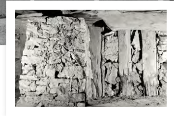
▲ DÉTAIL DU CELLIER DE LA MAISON AMOUREUX MONTRANT LES POTEAUX VERTICAUX EN CHÊNE QUI S'ENFONCENT DANS LE SOL, PHOTOGRAPHIÉ EN 1986

Les maisons de style « français » possèdent une galerie (porche). Leur structure est en poutres, soit placées sur une surface horizontale (« poteaux sur sole »), soit s'enfonçant dans le sol (« poteaux en terre »). Les murs sont en planches, ou en colombage et crépis.