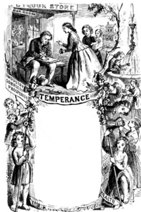
REPRODUCTIONS DES PROMESSES DES SOCIÉTÉS DE TEMPÉRANCE IRLANDAISE, CANADIENNE-FRANÇAISE ET PROTESTANTE. (PROTESTANTE)