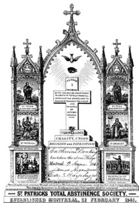
REPRODUCTIONS DES PROMESSES DES SOCIÉTÉS DE TEMPÉRANCE IRLANDAISE, CANADIENNE-FRANÇAISE ET PROTESTANTE. (IRLANDAISE) Archives de la paroisse Saint-Patrick.