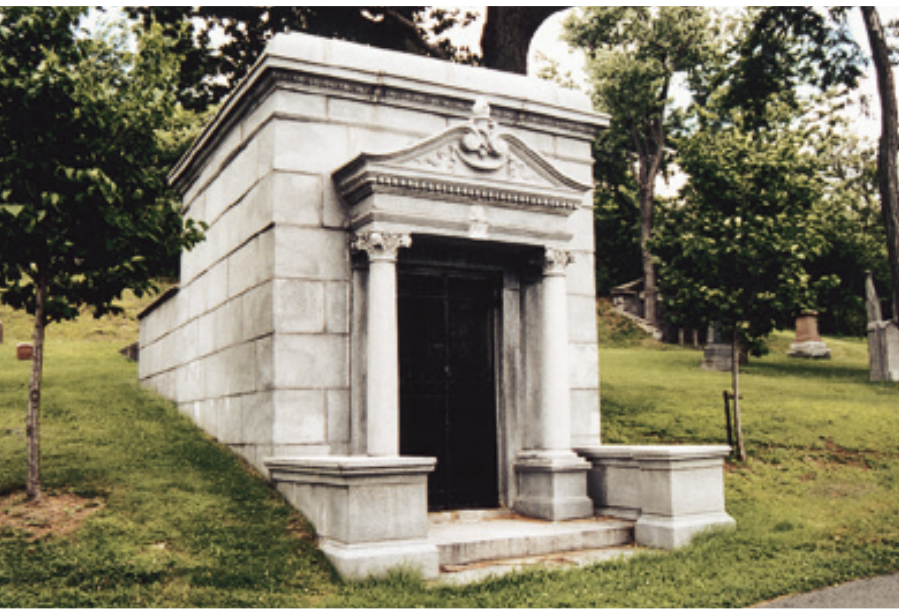
CAVEAU DE LA FAMILLE BAGG AU MOUNT ROYAL CEMETERY.

ces deux populations. Elle est également due à la promotion sociale que connurent les Irlandais de deuxième et troisième générations. Ce sont en effet ces derniers qui érigèrent des monuments à la mémoire de leurs parents immigrants — plus souvent d'ailleurs à la mémoire de la mère qu'à celle du père. C'est pourquoi, chez cette population de manœuvres et d'autres personnes qui, de leur vivant, n'avaient certainement pu payer qu'un loyer modeste, on compte un nombre surprenant d'individus dont les tombes peuvent encore aujourd'hui être identifiées. Certaines des inscriptions gravées sur ces tombes évoquent leurs origines : « [...] née dans le comté de Kilkenny, en Irlande », lit-on sur l'une d'elles.