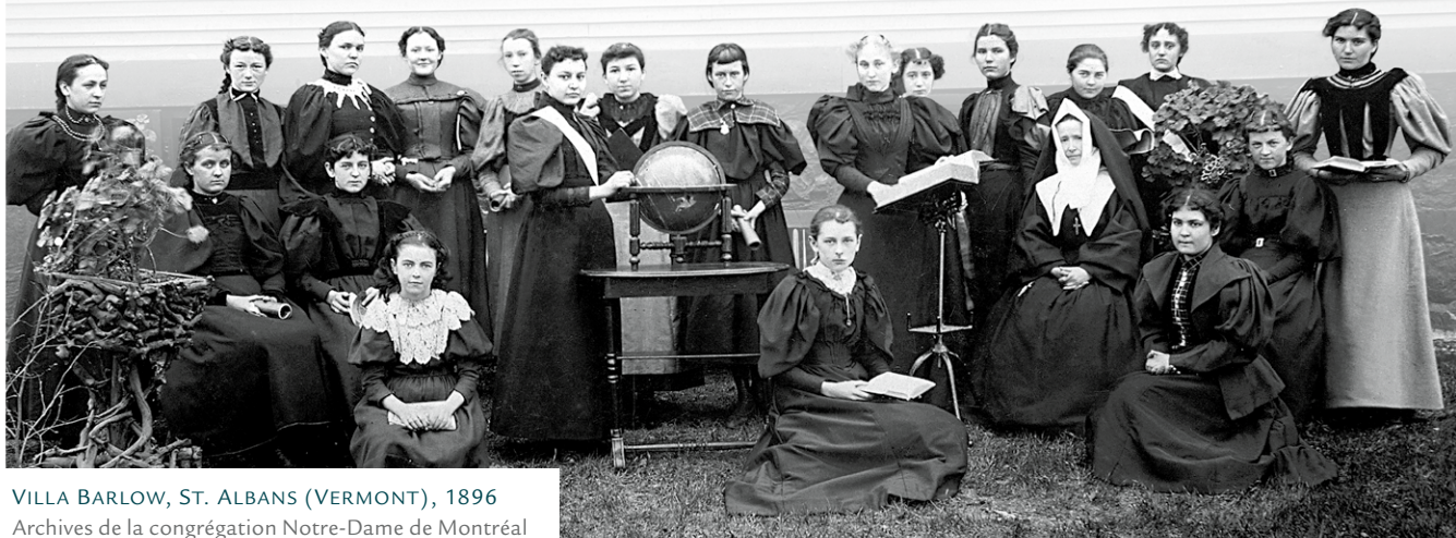
VILLA BARLOW, ST. ALBANS (VERMONT), 1896

Élèves de la distinguée « finishing school » St. Albans au Vermont.