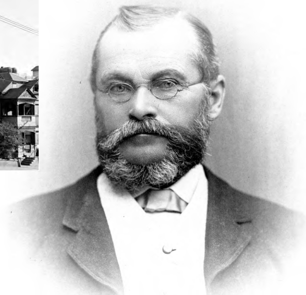
PRUDENT BEAUDRY VERS 1884 ▲ Bibliothèque et Archives nationales du Québec (Québec), P1000,S4,D83,PB126

Prudent Beaudry, un Canadien français élu maire de Los Angeles en 1875, se fait le principal promoteur d'un développement cossu sur la Bunker Hill (en plein cœur du centre-ville actuel) qui profitera d'un contexte spéculatif favorable engendré par le développement rapide du chemin de fer.