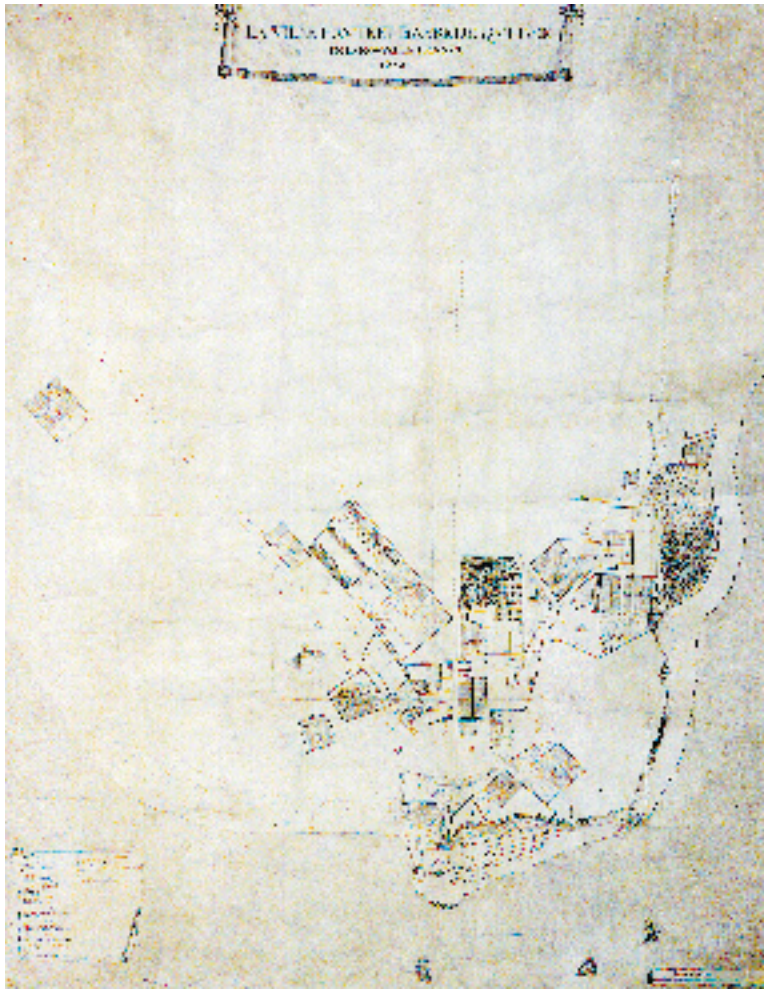
LA VILLE HAUTE ET BASSE DE QUEBEC EN LA NOUVELLE-FRANCE, 1670. Archives Nationales du Canada, Anonyme, 1670, NMC-11088. Parcs Canada, PC 100/00/1c-97.

reste sur la glace. En fait, la pression pour un développement vers l'ouest ne se fait pas sentir, car jusqu'à la fin du Régime français, l'enclos du séminaire et la rue Saint-Jean absorbent en grande partie l'expansion démographique, de même que le quartier du Palais qui se développe avec l'établissement d'un chantier de construction navale du côté de la rivière Saint-Charles.