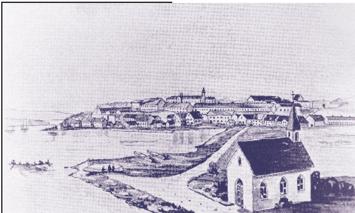
L'ERMITAGE DES RÉCOLLETS DANS LE QUARTIER SAINT-ROCH. En 1692, les récollets s'établissent dans ce lieu de retraite qu'ils placent sous la protection de Saint-Roch.