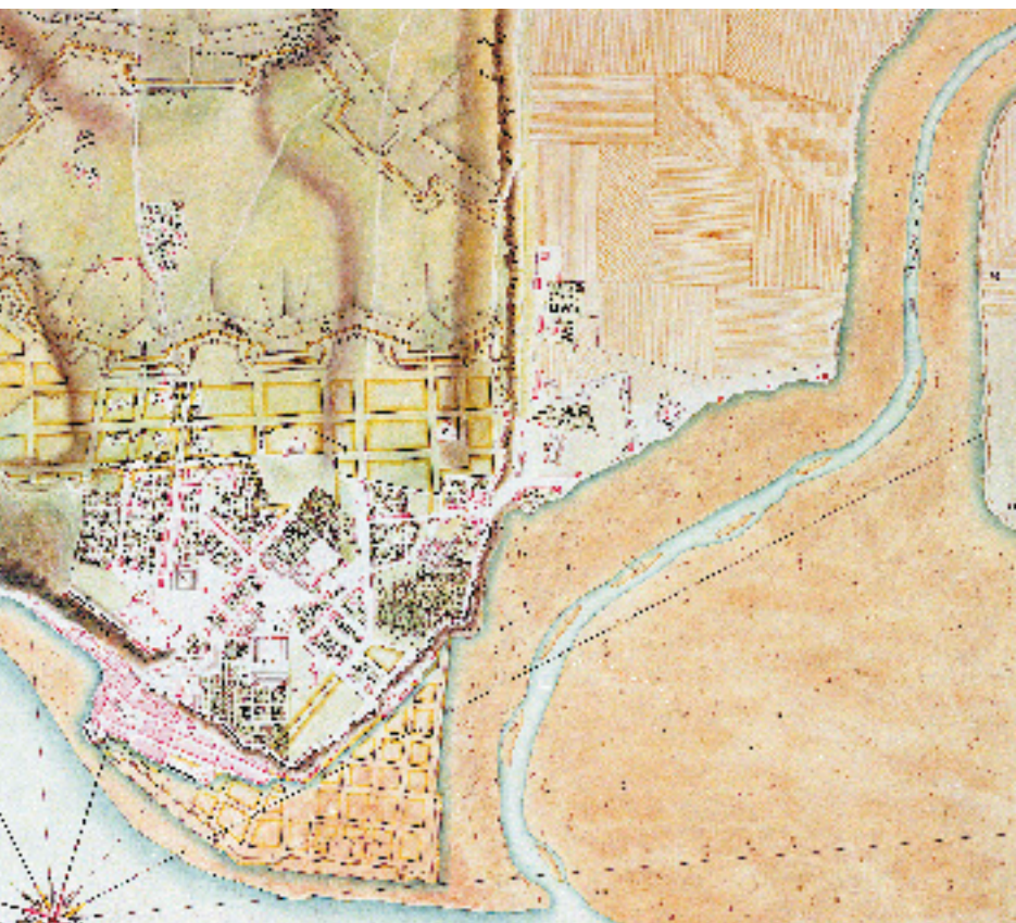
PLAN DE LA VILLE DE QUÉBEC, CAPITALE DU CANADA, NOUVELLE-FRANCE. Archives nationales du Canada, Chaussegros de Léry, 1716, NMC-1707. Parcs Canada, PC 100/00/1c-225.

L'essor démographique, l'expansion physique et le développement économique de Québec entraînent également une diversification des métiers et, dans certains cas, des regroupements géographiques de certains professionnels se précisent ou se dessinent. En ce sens, le caractère de la basse-ville demeure le même tout au long du Régime français, alors que celui de la haute-ville se transforme. La basse-ville demeure le lieu de prédilection des marchands, des artisans et de tous les gens pratiquant des métiers reliés au port et à la construction navale. Elle partage toutefois ces deux dernières fonctions avec le quartier du Palais, où se trouvent un chantier de construction navale et un port de mouillage pour les bateaux. Avec la saturation de la basse-ville, marchands et artisans commencent à s'établir dans la haute-ville, mais la fonction commerciale demeure prépondérante dans la basse-ville. La haute-ville, quant à elle, est le centre des administrations civile, militaire et religieuse. Elle absorbe les marchands et les artisans qui ne peuvent s'établir dans la basse-ville, mais elle voit plusieurs artisans ainsi que de nombreux ouvriers la quitter en faveur des faubourgs naissants, dont le faubourg Saint-Roch. Ainsi, la haute-ville développe au cours du XVIII e siècle un caractère commercial, mais elle est surtout dominée par la présence des services.