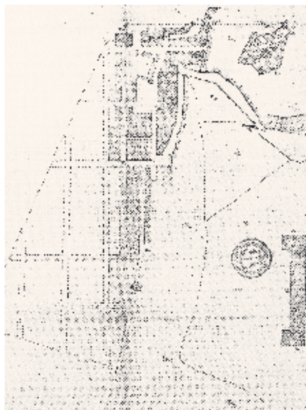
PLAN GÉOMÉTRIQUE DE LA BASSE VILLE DE QUÉBEC, AVEC PARTIE DE LA HAUTE VILLE. Archives nationales du Canada, Jean-Baptiste Franquelin, 1683, NMC 1585. Parcs Canada, PC 100/00/1c-98.