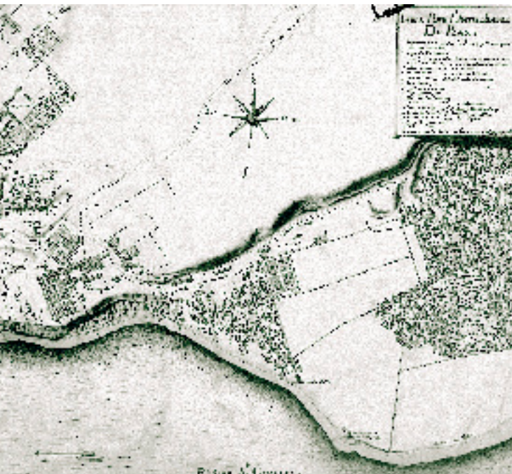
PLAN DE LA VILLE ET CHASTEAU DE QUÉBEC, FAIT EN 1685, MESURÉE EXACTEMENT. Archives nationales du Canada, Robert de Villeneuve, 1685, C-15797. Parcs Canada, PC 100/00/1c-99.