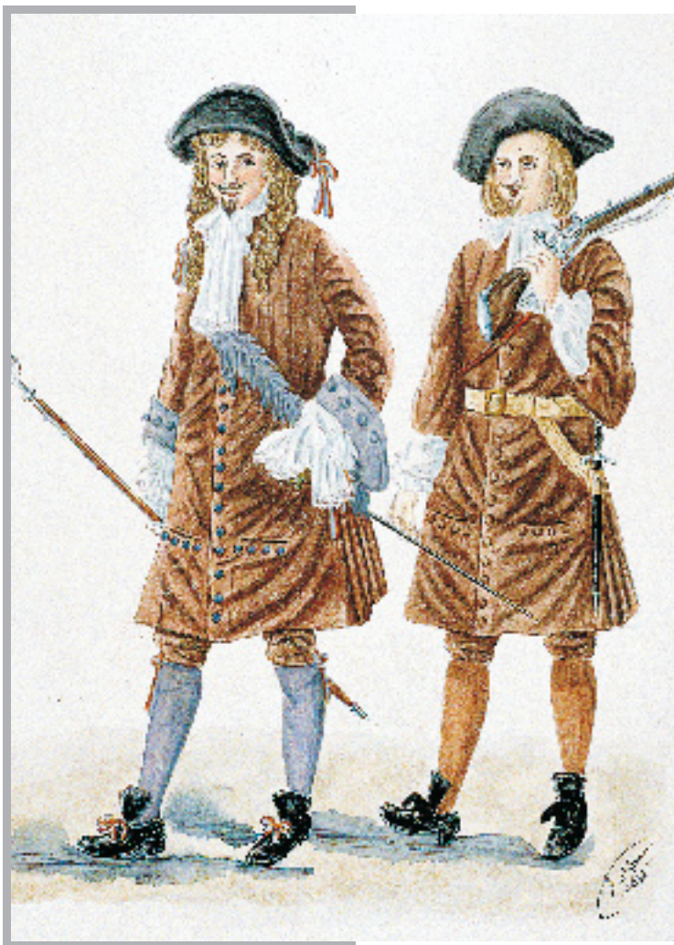
SOLDATS DU RÉGIMENT DE CARNIGNAN-SALIÈRES OU DES COMPAGNIES FRANCHES DE LA MARINE. Archives nationales du Québec, P600, S5, PAQ33.

années 1680, devant la menace d'une nouvelle guerre avec les Iroquois, la colonie demande à nouveau des troupes. En 1683, la Marine française envoie à Québec plus de 150 soldats répartis en trois compagnies. Affranchies du ministère de la Marine, puisqu'elles relèvent directement du roi, elles seront connues sous le nom de Compagnies franches de la Marine. À la veille de la Conquête, 40 compagnies seront présentes dans la colonie, dont plusieurs en garnison