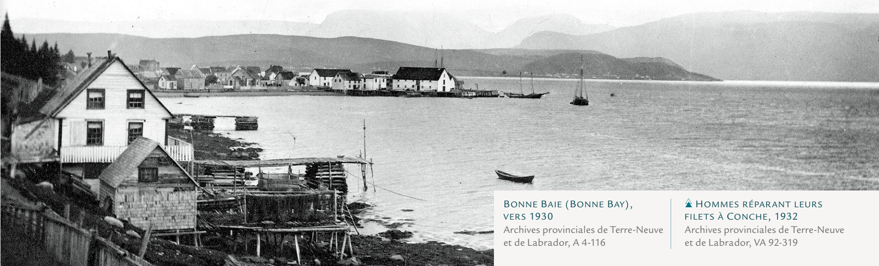
BONNE BAIE (BONNE BAY), VERS 1930

Archives provinciales de Terre-Neuve et de Labrador, A 4-116