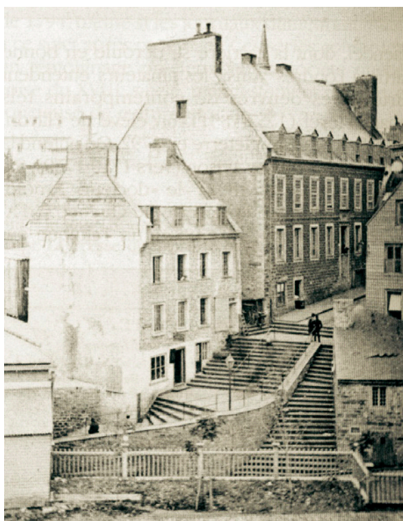
AUBERGE DU CHIEN D'OR, DEVENUE, APRÈS LA CONQUÊTE, LE FREE MASONS HALL. Archives nationales du Québec, collection initiale.