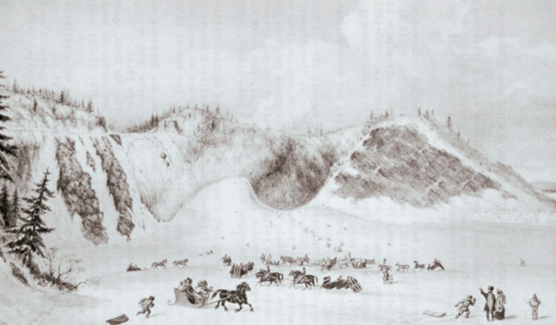
EXCURSION AUX CHUTES MONTMORENCY, VERS 1850.

Archives nationales du Canada, C. Krieghoff, C-11007.