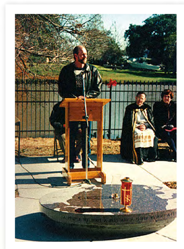
▼ CÉRÉMONIE D'INAUGURATION DE LA « FLAMME ÉTERNELLE », 10 DÉCEMBRE 1995

Il est également possible que la chute de la revendication identitaire soit une manifestation d'ethnicité symbolique, autrement dit une identification superficielle qui ne repose pas sur la pratique quotidienne d'une différence culturelle. De fait, le nombre de locuteurs francophones continue de baisser : ils étaient 198 000 en 2000, 63 000 de moins qu'en 1990. Le déclin qui semblait avoir ralenti entre 1980 et 1990, avec une perte de seulement 2 000 locuteurs, s'est de nouveau accéléré. De plus, la proportion de jeunes locuteurs s'amenuise, les moins de 18 ans ne représentant que 8,4 % du nombre de francophones. Enfin, la disparition statistique de 400 000 Cadiens peut également s'expliquer par la modification de la méthodologie des recenseurs. En effet, le questionnaire de 2000 n'a pas fait figurer les termes acadien et cajun, employés comme synonymes, dans la liste des exemples accompagnant la question relative à l'origine ethnique. Ne voyant pas de référence à leur identité, peut-être les Cadiens ont-ils jugé inutile ou inopportun de la mentionner, conformément à « l'effet d'exemple » déformant mis en lumière par les statisticiens du Bureau de recensement.