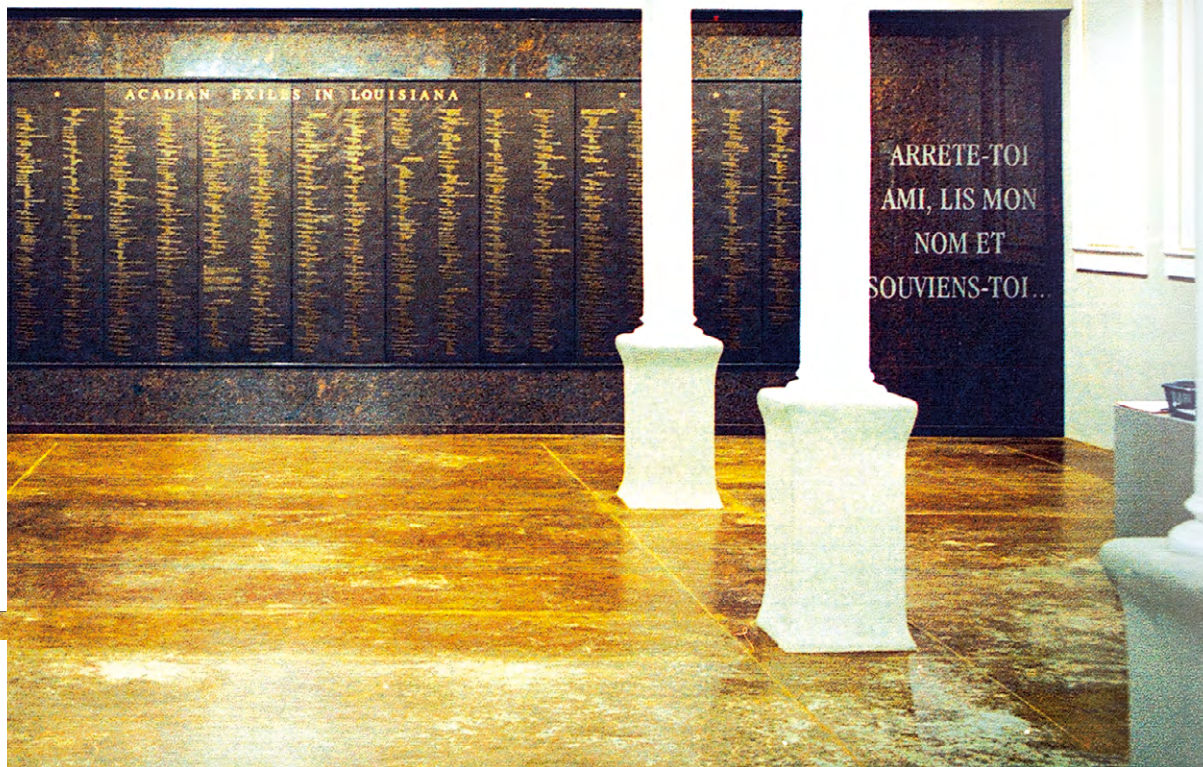
MUR DES NOMS DE 3 000 RÉFUGIÉS AU MÉMORIAL ACADIEN DE SAINT-MARTINVILLE Mémorial acadien de Saint-Martinville