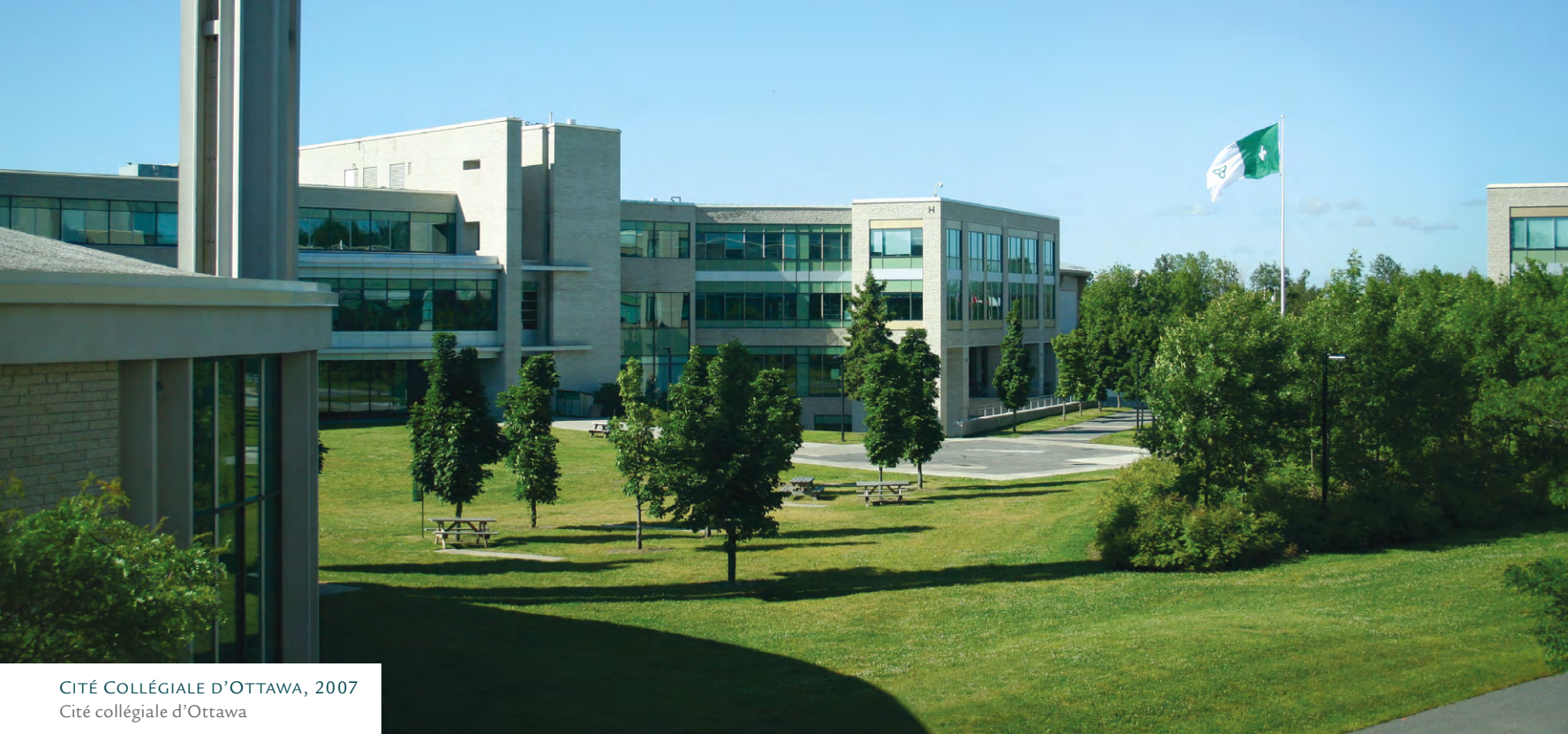
CITÉ COLLÉGIALE D'OTTAWA, 2007 Cité collégiale d'Ottawa

Avec un tiers de sa population étudiante issue de l'immigration francophone récente, la Cité collégiale d'Ottawa témoigne des changements qui s'opèrent dans la francophonie canadienne. Fondée en 1990, la Cité est le premier collège communautaire de langue française en Ontario.