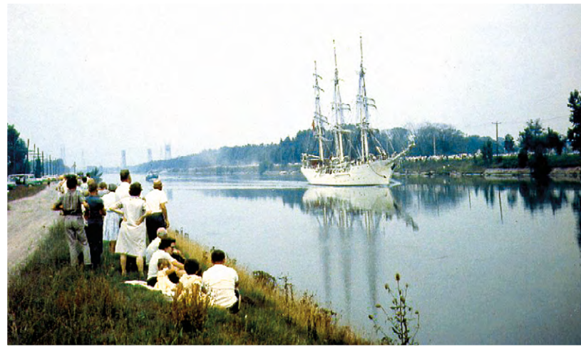
▲ CANAL WELLAND – LE TROIS MATS NORVÉGIEN CHRISTAN RADICH, 1979 Reg & Ruth Deacon. Niagara Falls (Ontario) Public Library, 96176

Le tracé et la capacité d'origine du canal sont remaniés à quatre reprises après 1829, permettant le passage de voiliers, de vapeurs, puis de « lakers » de plus en plus grands. La dernière modification a lieu dans les années 1970 pour éviter le centre-ville de Welland.