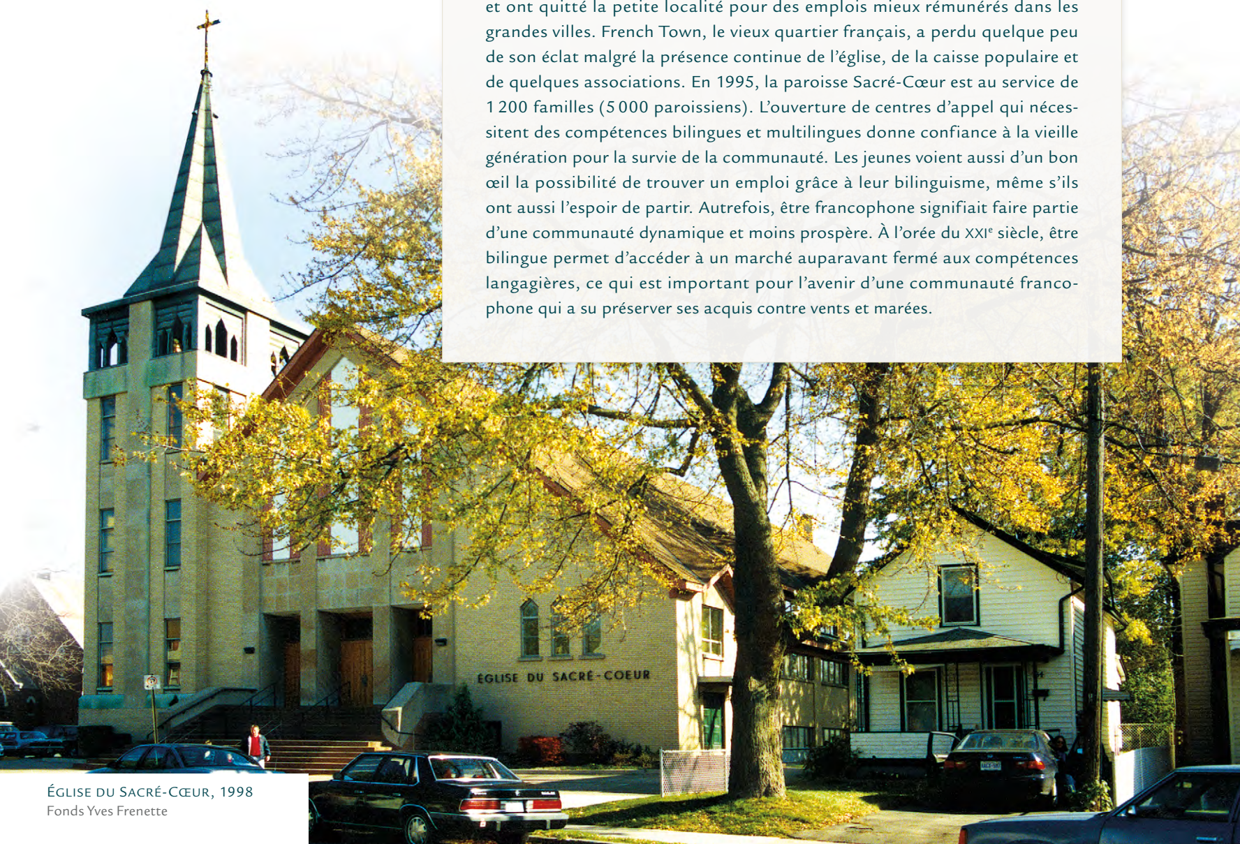
ÉGLISE DU SACRÉ-CŒUR, 1998

..... La minorité francophone de Welland a été touchée par des changements économiques, politiques et sociaux importants. Les gens se sont dispersés et d'autres se sont tournés vers la langue anglaise à la recherche de meilleures ressources. Certains jeunes ont opté pour une scolarisation plus poussée et ont quitté la petite localité pour des emplois mieux rémunérés dans les grandes villes. French Town, le vieux quartier français, a perdu quelque peu de son éclat malgré la présence continue de l'église, de la caisse populaire et de quelques associations. En 1995, la paroisse Sacré-Cœur est au service de 1 200 familles (5 000 paroissiens). L'ouverture de centres d'appel qui nécessitent des compétences bilingues et multilingues donne confiance à la vieille génération pour la survie de la communauté. Les jeunes voient aussi d'un bon œil la possibilité de trouver un emploi grâce à leur bilinguisme, même s'ils ont aussi l'espoir de partir. Autrefois, être francophone signifiait faire partie d'une communauté dynamique et moins prospère. À l'orée du XXI e siècle, être bilingue permet d'accéder à un marché auparavant fermé aux compétences langagières, ce qui est important pour l'avenir d'une communauté francophone qui a su préserver ses acquis contre vents et marées.