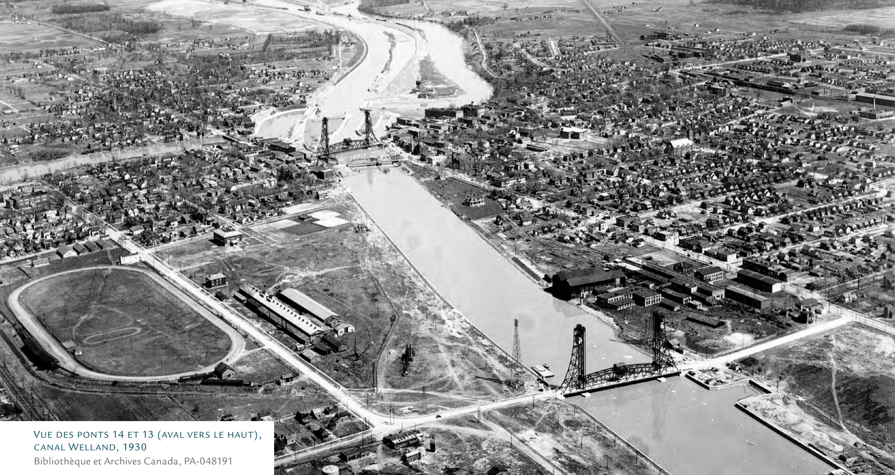
VUE DES PONTS 14 ET 13 (AVAL VERS LE HAUT), CANAL WELLAND, 1930

Sacré-Cœur sera créée en 1947 dans le sous-sol de l'église et aura son propre bâtiment en 1948. Plus tard, elle sera nommée la Caisse populaire de Welland. Il existe également quelques marchands francophones offrant des services en français.