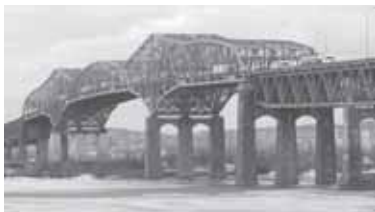
(à droite, Le Pont Champlain / right, Champlain Bridge)