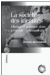
La société des identités Éthique et politique dans le monde contemporain Jacques Beauchemin