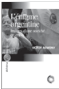
L'énigme argentine Images d'une société en crise Victor Armony