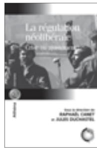
La régulation néolibérale Crise ou ajustement ? sous la direction de Raphaël Canet et Jules Duchastel