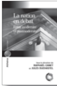
La nation en débat Entre modernité et post-modernité sous la direction de Raphaël Canet et Jules Duchastel