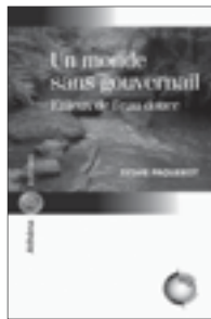
Un monde sans gouvernail Enjeux de l'eau douce Sylvie Paquerot