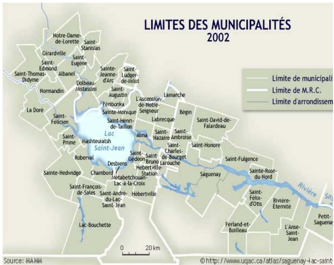
CARTE 1 Région du Saguenay–Lac-Saint-Jean