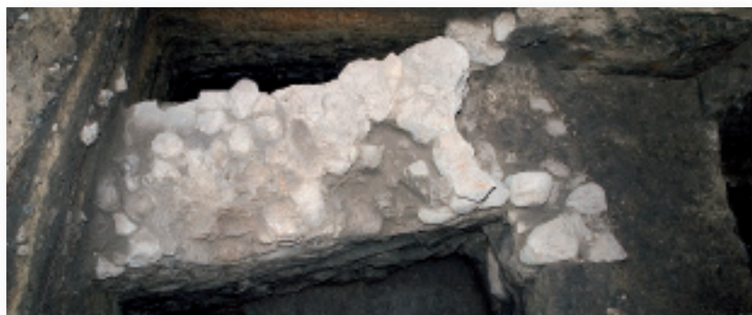
▲ Une section de la maçonnerie du fort Ville-Marie dégagée en 2006. Cet élément architectural mesure près d'un mètre d'épaisseur.

Lorsque Paul de Chomedey de Maisonneuve et Jeanne Mance, les cofondateurs de Montréal manda-