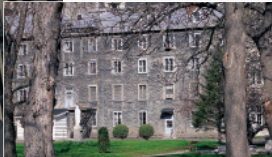
▲ Le corps principal du séminaire de Saint-Sulpice (1684-1687), vu du jardin. Un étage de soubassement et deux sous-sols superposés sont voûtés. Outre l'Hôpital général (1693), c'est le seul immeuble du XVII e siècle dans le Vieux-Montréal ; il a été classé en 1985. Les sulpiciens habitent encore leur vieux séminaire et y conservent archives et livres rares. En 2007, diverses manifestations ont rappelé le 350 e anniversaire de leur arrivée.