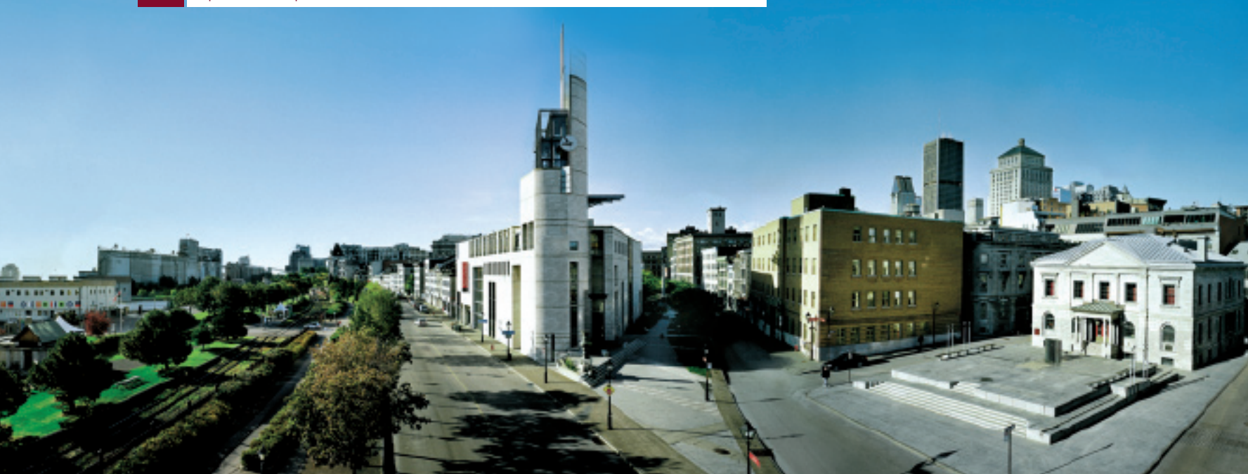
▲ Pointe-à-Callière, au cœur du Vieux-Montréal, site de fondation de la ville. À gauche, la rue de la Commune et le Vieux-Port; à droite, la place Royale, qui surplombe la crypte archéologique et l'Ancienne-Douane.