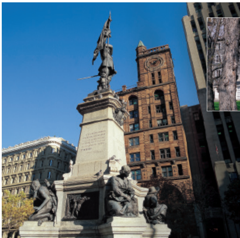
▲ Œuvre de Louis-Philippe Hébert située place d'Armes à Montréal, le monument à la mémoire de Paul de Chomedey, sieur de Maisonneuve, représente le fondateur de la ville entouré de quatre personnages en contre-bas, dont ici Jeanne Mance prenant soin d'un jeune Amérindien alors que l'ennemi iroquois est embusqué à gauche. Raphaël-Lambert Closse et Charles Le Moyne complètent le monument. Son érection a fait l'objet d'une souscription publique en 1891, à la veille des célébrations du 250 e anniversaire de la ville. Il est finalement dévoilé en 1895.