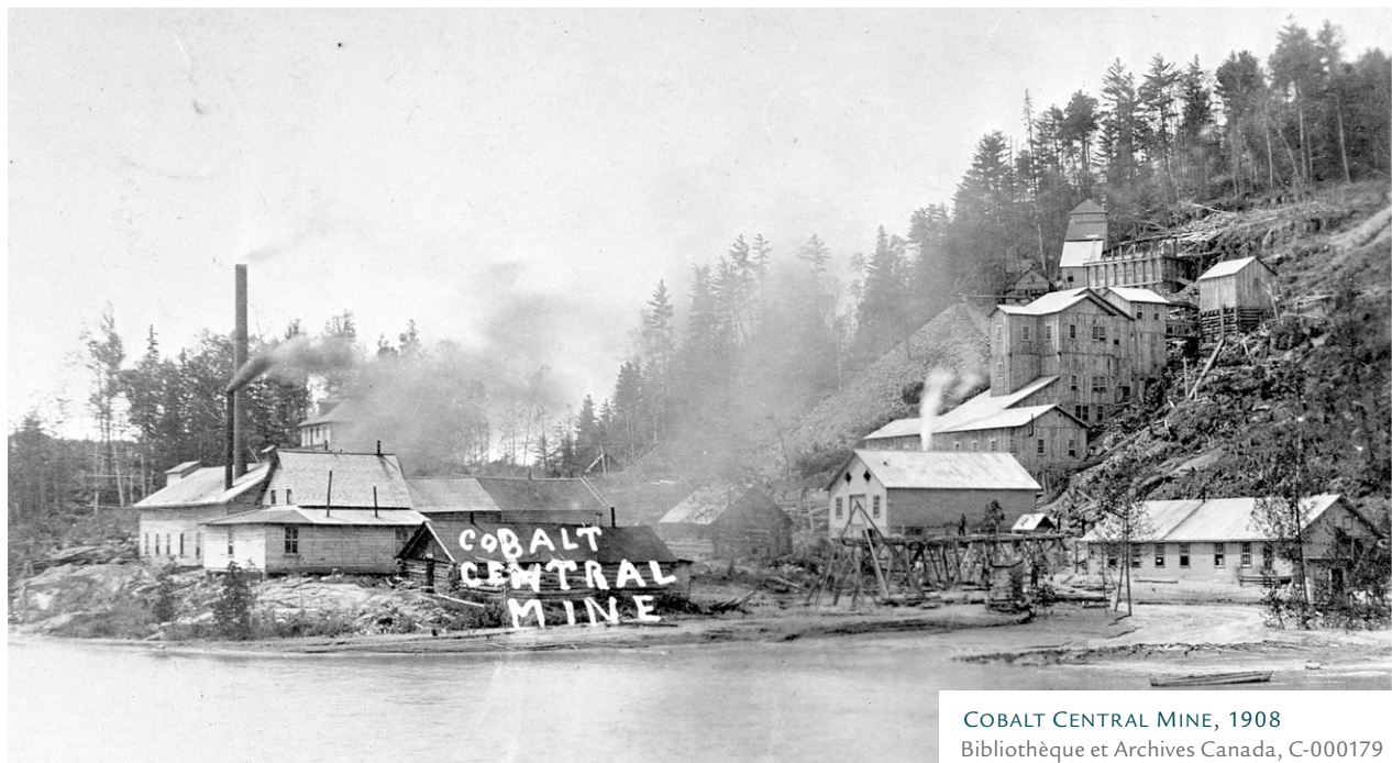
COBALT CENTRAL MINE, 1908

La mise en valeur des gisements miniers amène la création d'établissements, dont plusieurs francophones.