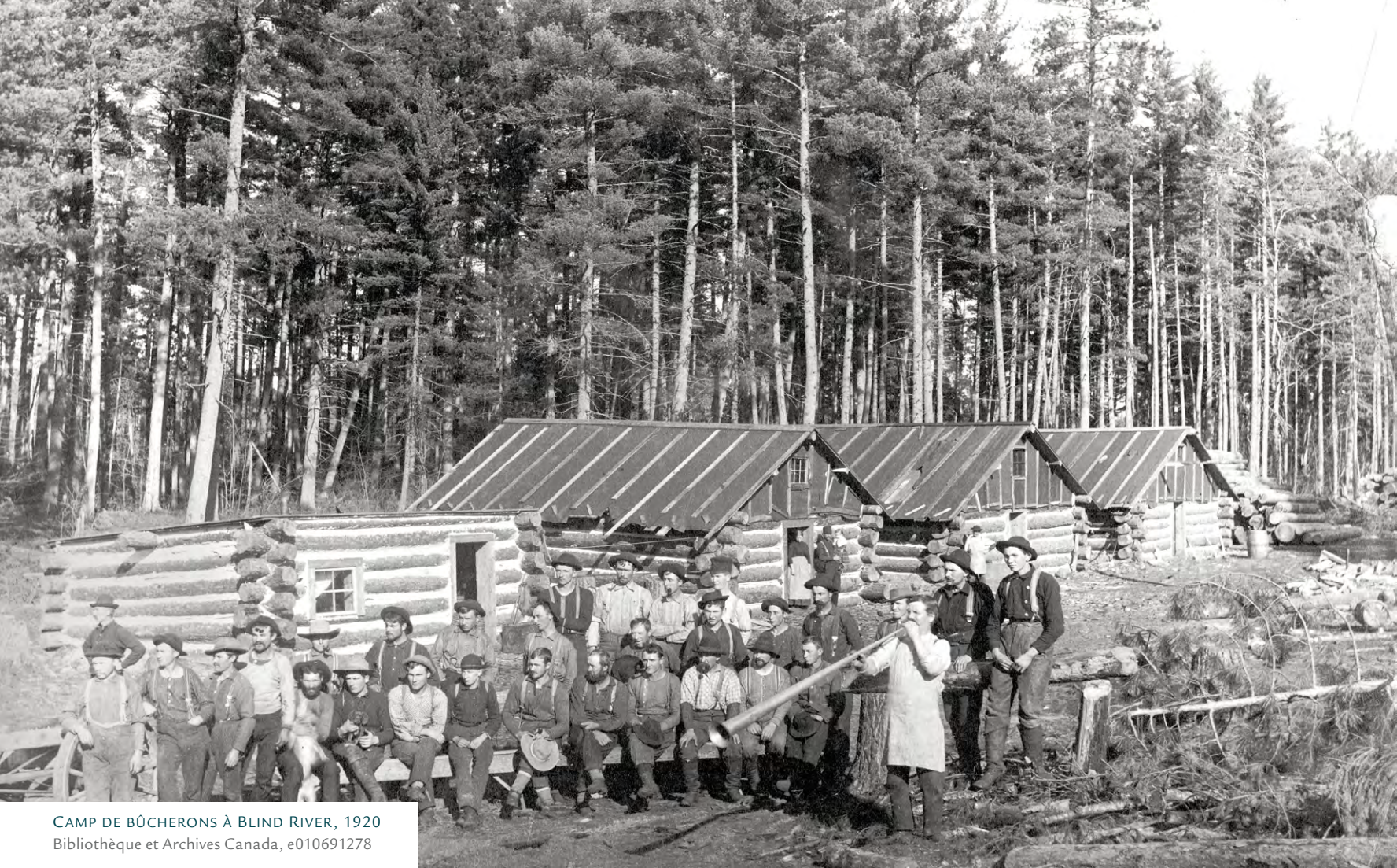
CAMP DE BÛCHERONS À BLIND RIVER, 1920

ment de cette région commencèrent dans la foulée des activités forestières durant le dernier tiers du XIX e siècle.